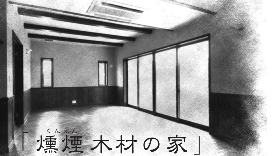
化粧梁とムク腰板を貼った風通しの良いリビングルーム