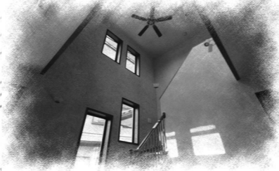
広々としたリビングの吹抜