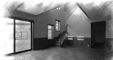
珪藻土塗りの落ち着いたあるLDK

柱・梁には国産ムク材100%の燻煙木材を使用しています。国産材を活用する事は国内の森の活性化にも繋がり日本の山を守り日本の環境保全に役立っています。その上燻煙乾燥する事は木材の繊維を破壊する事なく耐久性、防腐・防虫・防カビ性を向上させます。どんなに環境に気を使っても10年で壊れてしまう家では元も子もありません。長持ちする事も環境に優しい家づくりの重要なポイントです。さらに、耐震性に配慮した頑固な構造と深い軒を設けることで雨の多い日本の気候への配慮をし、家族と住まいを守る高機能調湿壁材である「珪藻土」、高い調湿機能と断熱性能とを合せ持つ「サーモウル」を標準としています。